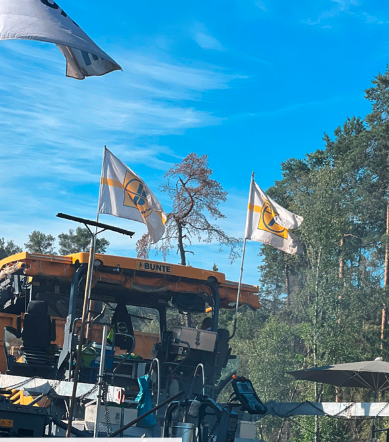
BAB A3 Asphaltteinbau

Die JOHANN BUNTE Bauunternehmung SE & Co. KG ist eine der führenden Bauunternehmungen in Deutschland mit langer Firmengeschichte und hoher Marktpräsenz. 1872 in Papenburg im Emsland gegründet, ist BUNTE heute als Generalanbieter von Bauleistungen mit zahlreichen Niederlassungen und Beteiligungen sowie einem breiten Leistungsspektrum in fünf Geschäftsfeldern überregional erfolgreich tätig. BUNTE ist in ganz Deutschland zu Hause.