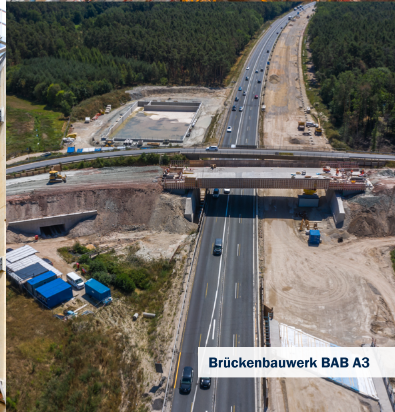
Brückenbauwerk BAB A3