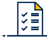
Unterstützung in der Prüfungsvorbereitung